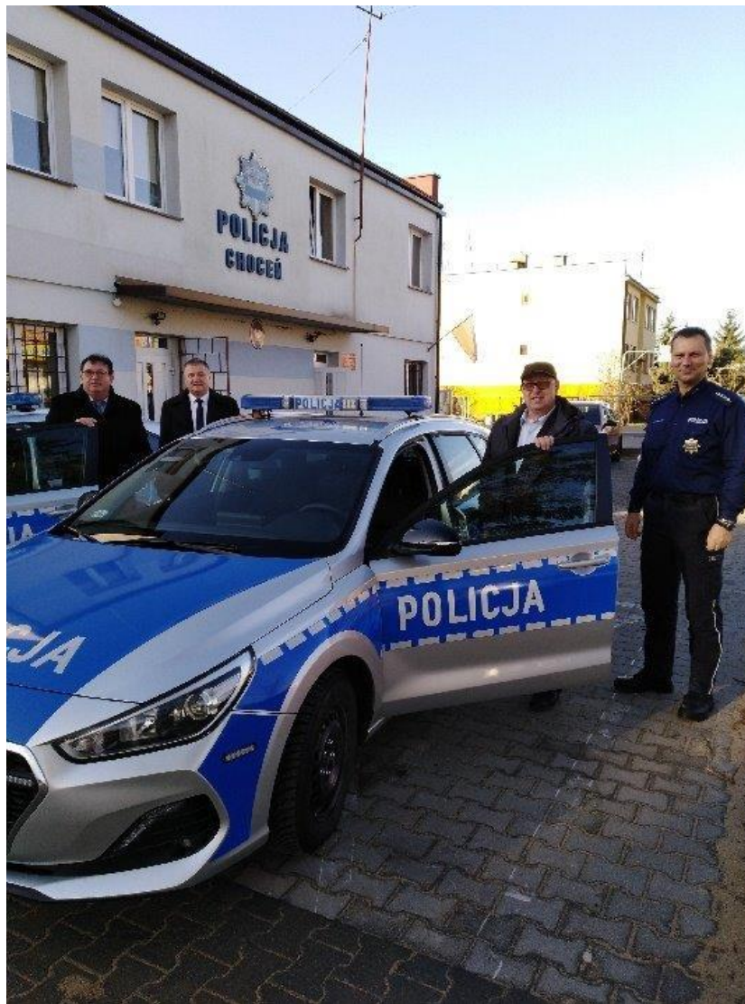
Dofinansowanie samochodu dla Policji