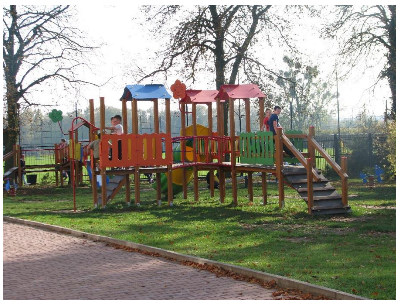
Dostawa i montaż siłowni zewnętrznych i elementów placów zabaw w Choceniu