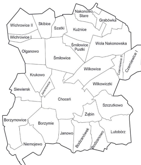
Rysunek. Podział Gminy na sołectwa