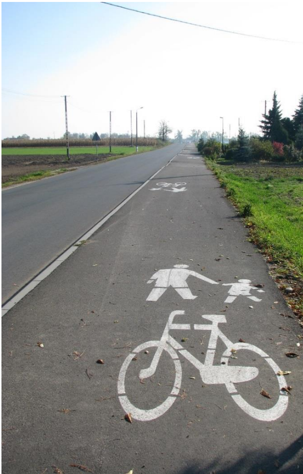
Budowa ścieżek pieszo – rowerowych na terenie gminy Chocień