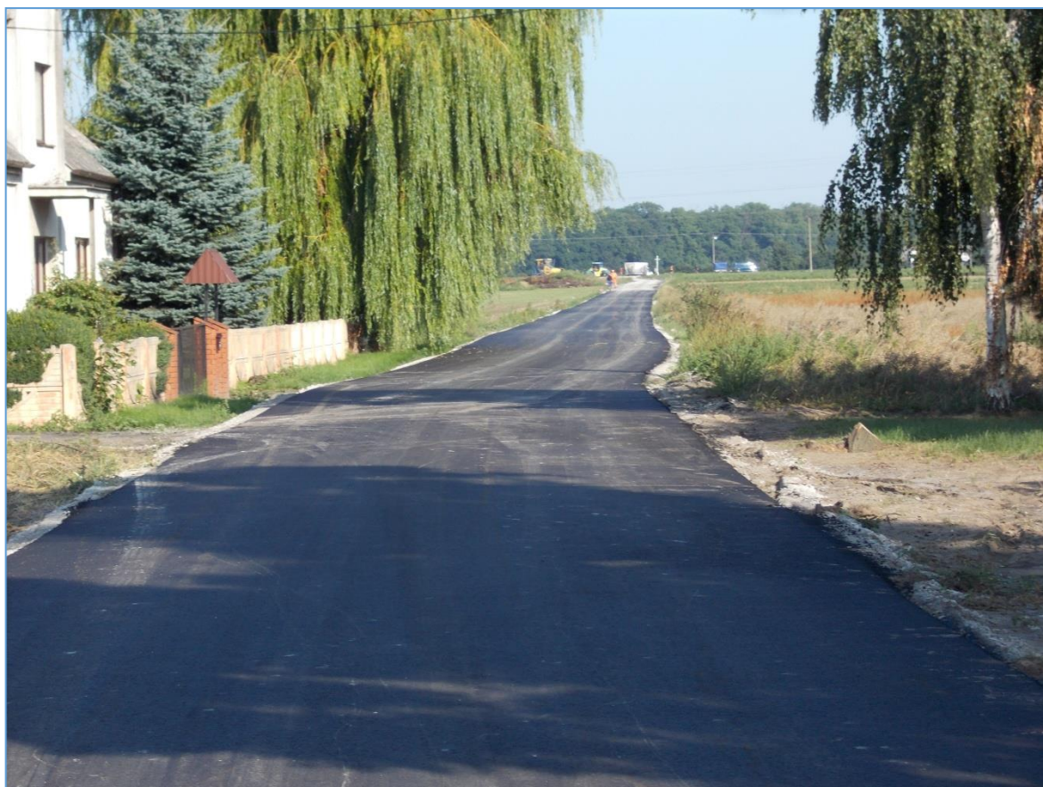
Droga tzw. skośna w Skibicach na odcinku 722