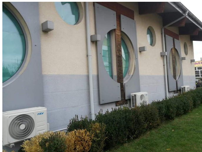
Projekt „Gmina Chocień wspiera niesamodzielných” w Chocieńskim Centrum Kultury – Biblioteka - dostosowanie pomieszczeń do potrzeb prowadzenia Klubu Seniora -zamontowanie klimatyzacji oraz warsztaty plastyczne, komputerowe, wokalne, folklorystyczne i gimnastyka