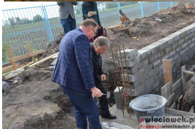
Wmurowanie kamienia węglanego oraz rozpoczęcie prac przy budowie fundamentów sali gimnastycznej Szkoły Podstawowej im. Anny Wajcovicz w Śmiłowicach