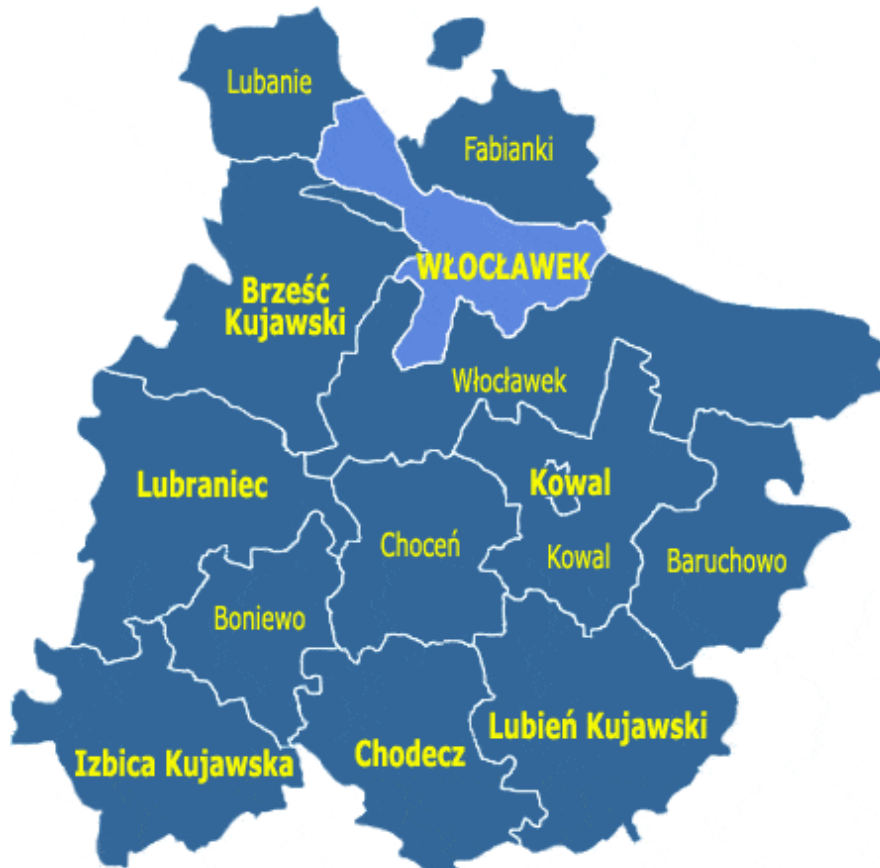
Rysunek 1. Położenie Gminy Choceń w powiecie włocławskim

Gmina położona jest w północnej części województwa kujawsko-pomorskiego. Gmina graniczy: z gminami – Boniewo, Chodecz, Kowal, Lubień Kujawski, Lubraniec, Włocławek