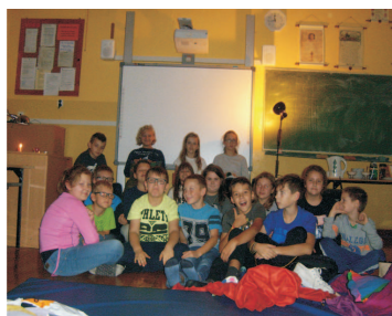
PIERWSZY MARATON CZYTELNICZY W SP CHOCEŃ!

21 października 2016 roku kilka godzin spędziliśmy w szkole na wspólnym czytaniu baśni. Maraton czytelniczy trwał nieprzerwanie osiem godzin. W zaszarowanym, baśniowym świecie przemieśli nas uczniowie czytając książki, które przyniesiły ze sobą. W czasie tego magicznego wieczoru gościliśmy rodziców, a także babcie i dziadków. Dodatkowych emocji uczestnikom dostarczyło spotkanie z Dobrym Duchem Szkoły. Planujemy kolejne spotkania i już serdecznie na nie zapraszamy. A. Pawłowska