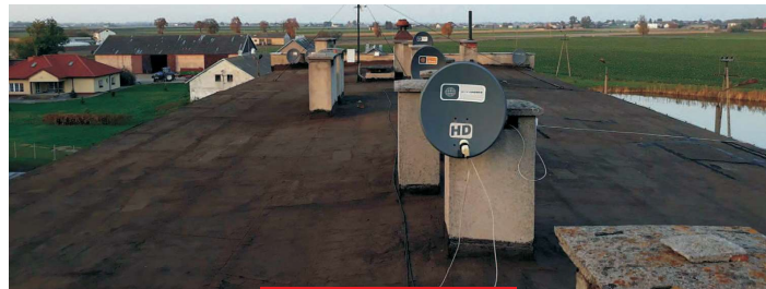
WILKOWICZKI PRZED ▲ PO ▼