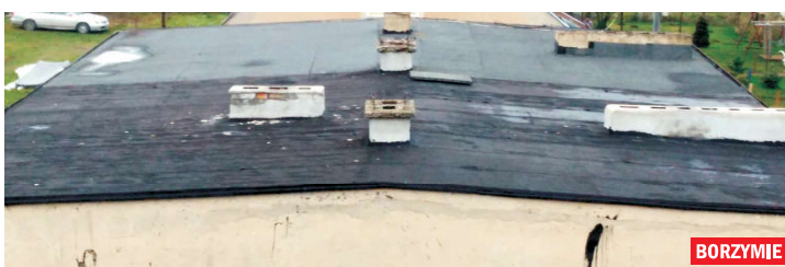
BORZYMIE ◀ PRZED | PO ▶