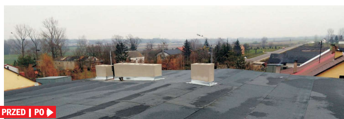
BORZYMIE ◀ PRZED | PO ▶