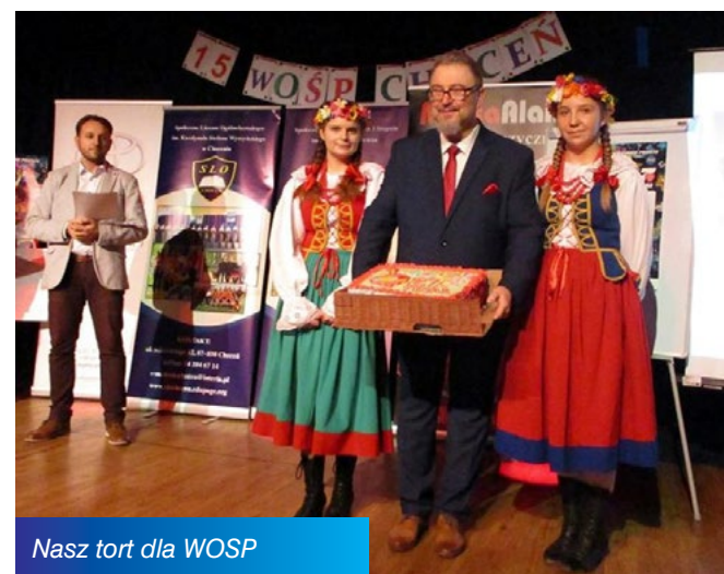
Nasz tort dla WOŚP

dlużej przerwie pojechaliśmy na mecz Anwilu do Hali Mistrzów we Włocławku. Uczniowie przeszli też szkolenie w zakresie samoobrony przed agresywnym psem. I jak widać, nie ma w naszej szkole tygodnia, w którym by się coś nie działo. Wszystkim naszym nauczycielom, rodzicom i uczniom za zaangażowanie w tworzenie wizerunku szkoły w Śmitowicach - dziękujemy. A na nadchodzące święta - Życzymy Zdrowych, Spokojnych i Radosnych Świąt Wielkanocnych.